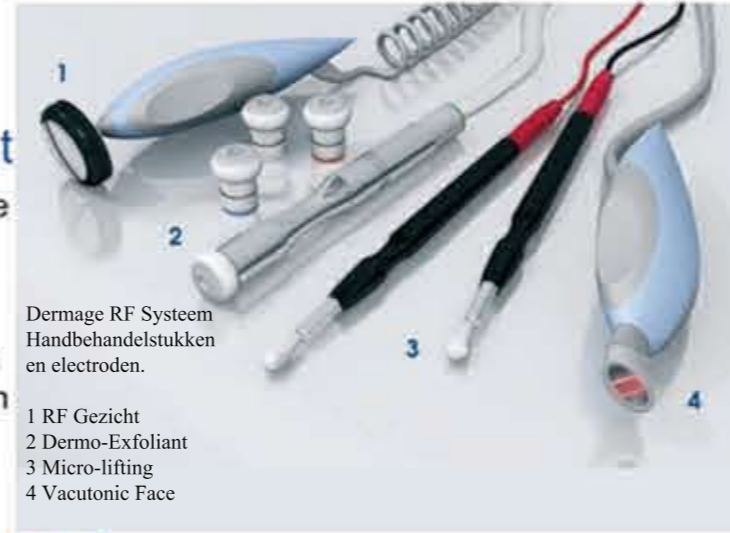
Dermage RF System Handbehandelstukken en elektroden. 1 RF Gezicht 2 Dermo-Exfoliant 3 Micro-lifting 4 Vacutonic Face

De aangename RF energie wordt op een gecontroleerde wijze op het gezicht toegepast. De weldadige RF warmte zorgt voor een biologisch Thermal-effect dat de fibroblasten in de huid activeert om nieuw collageen aan te maken. Hiermee worden twee effecten bereikt: het opvullen van rimpels en de vermindering van gezichtsplooiën, het lifting-effect van de huid voor zichtbare contour verbetering. De huid krijgt haar natuurlijke elasticiteit en stevigheid terug met een verbeterde tonus en een gezonde glans.