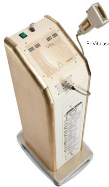
ReVitalase Pro Age Plus

Hierdoor wordt een signaal afgegeven aan de fybroblasten waardoor deze "denken" beschadigd te worden, zonder dat hiervan sprake is, en zij dus als 'herstel' aangezet worden tot collageensynthese. De combinatie van lichaamseigen ATP energie, ontstaan door ons 905 nm Laser-licht, samen met zuivere en hoogwaardige voedingssupplementen en transdermale vitamine C cosmetica, is op dit moment de meest perfecte synergie om tot daadwerkelijke, duurzame huidverbetering te komen."