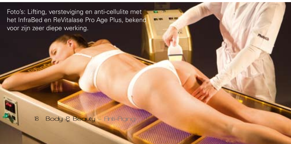
Foto's: Lifting, versteviging en anti-cellulite met het InfraBed en ReVitalase Pro Age Plus, bekend voor zijn zeer diepe werking.

van de cellen, (dus ook in de fibroblasten) de meest zuivere vorm van dit ATP aangemaakt. Dit lichaamseigen ATP verdient altijd de voorkeur boven eventueel extern (cosmetisch) ingebracht ATP. De 905 nm lichtbehandeling zorgt echter niet alleen voor een versnelde productie van ATP, maar er worden een reeks andere zeer belangrijke processen geïnitieerd zoals: een verhoogd proton elektrochemische potentiaal van mitochondriën en cel membraan, verhoogde RNA en proteïne synthese, verhoogd zuurstof gebruik, aanmaak van cel stimulerende enzymen en factoren zoals NO (stikstofmonoxide) en VEGF (groei factor), etc.